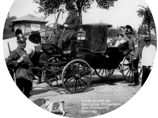
Kontrollpunkt der Bamberger Bürgerwehr.